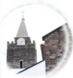
SÃO TIAGO, ROGAI POR NÓS